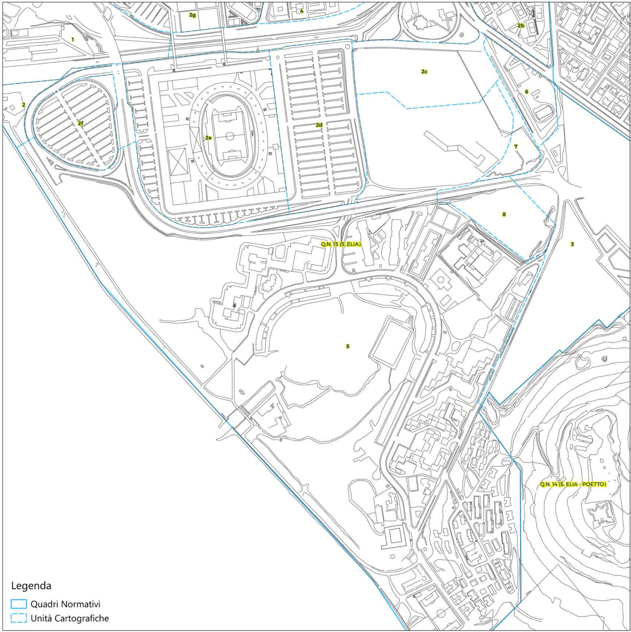
4 QUADRI NORMATIVI E UNITA' CARTOGRAFICHE - PUC VIGENTE