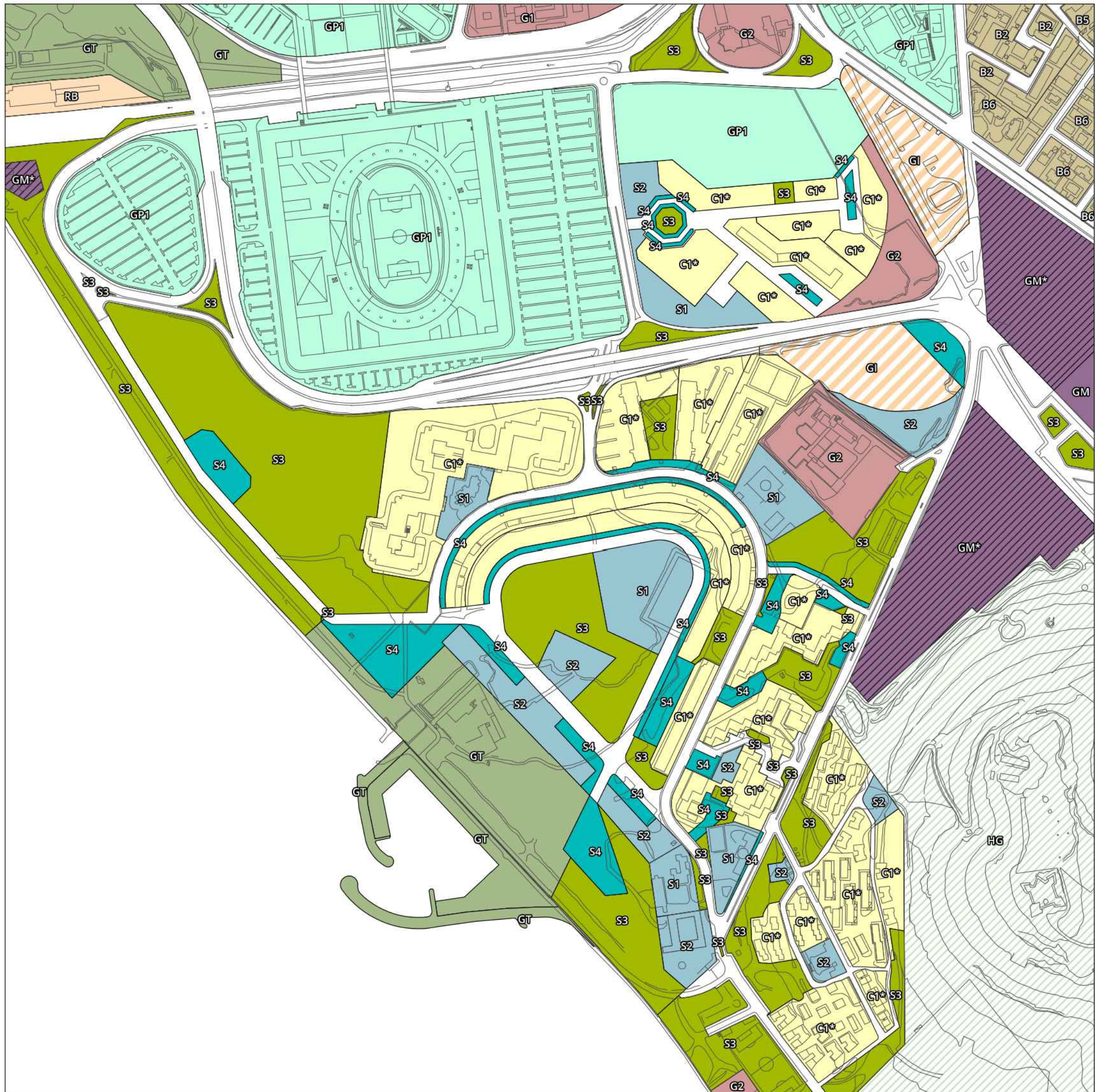
5 ZONIZZAZIONE - PUC VIGENTE