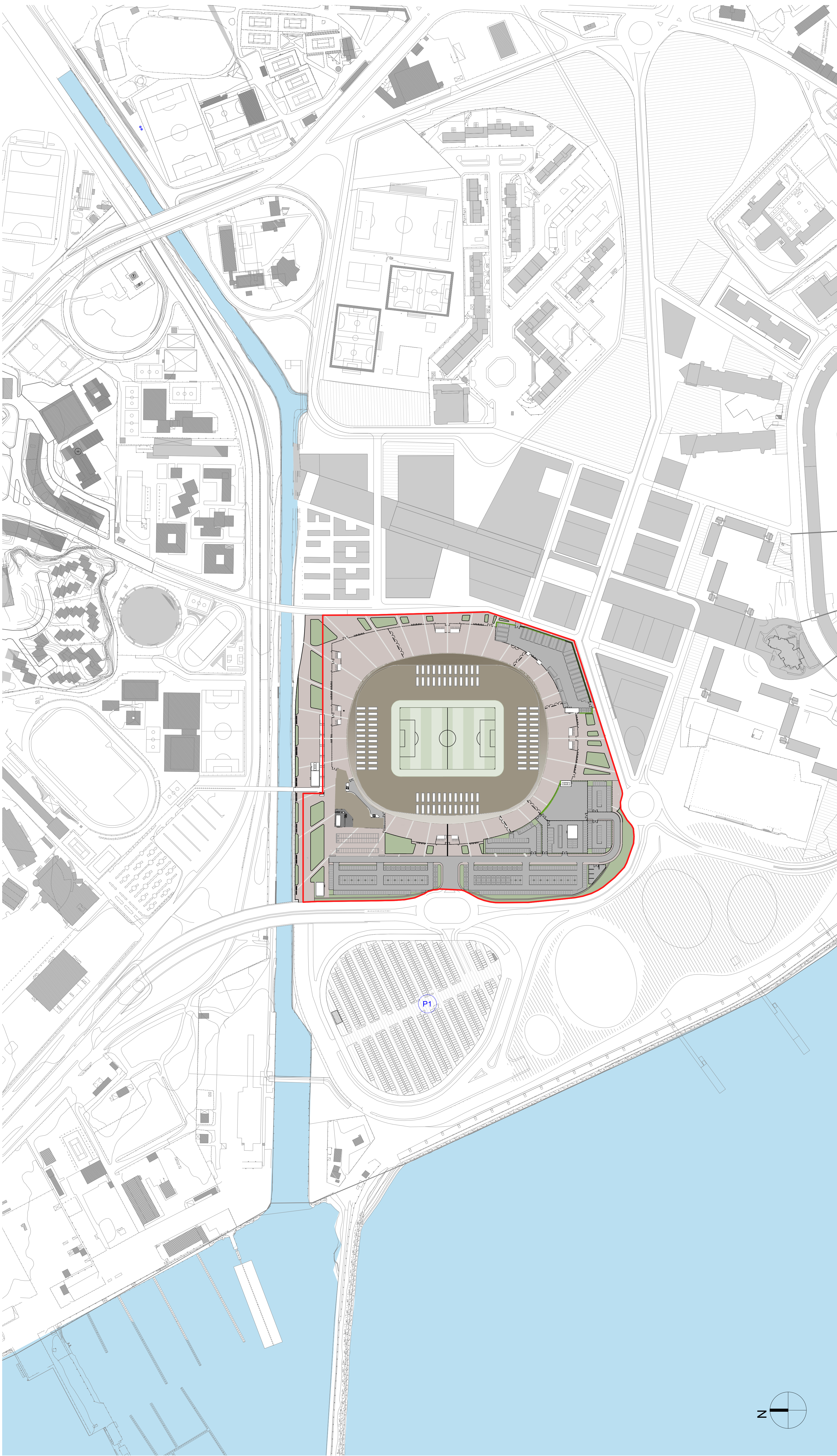
1 PLANIMETRIA GENERALE D'INQUADRAMENTO